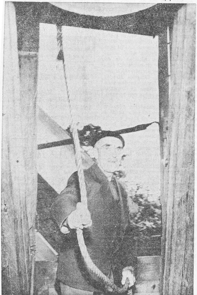
Kyrkvaktaren ringer bönringningen.

Ett sommartecken säkrare än alla andra är bönringningen i de många landsbygdskyrkorna. Den börjar 1 maj och slutar i september. Varje morgon och kväll har denna ringning förekommit i våra falbygdskyrkor allt sedan medeltiden.