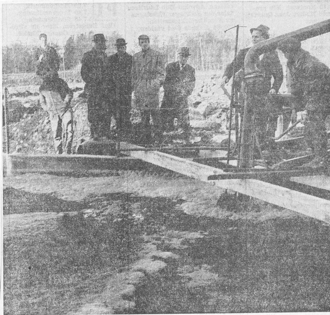
Samling vid pumpen — förstås, det var en särskild pump.