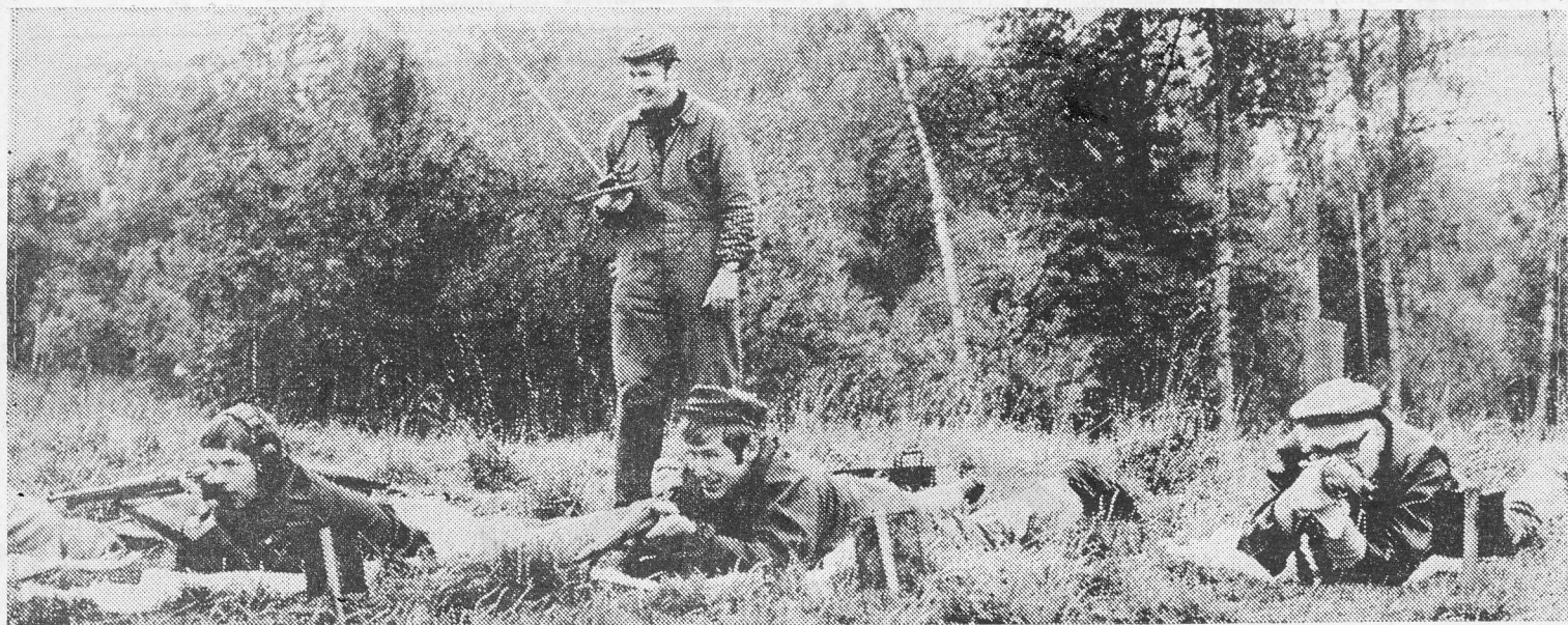
Det gällde att sikta på rätt gubbe, i gevärsskjutningen.