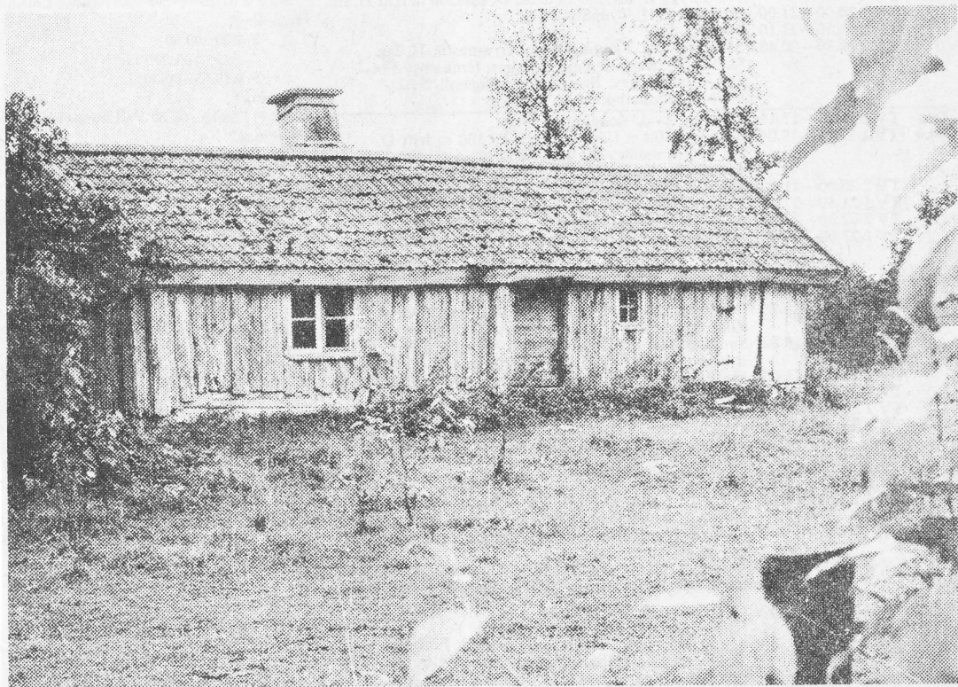
Gran-Annas stuga i Vårkumla blir upprustad av kommunen. 24/8-72.