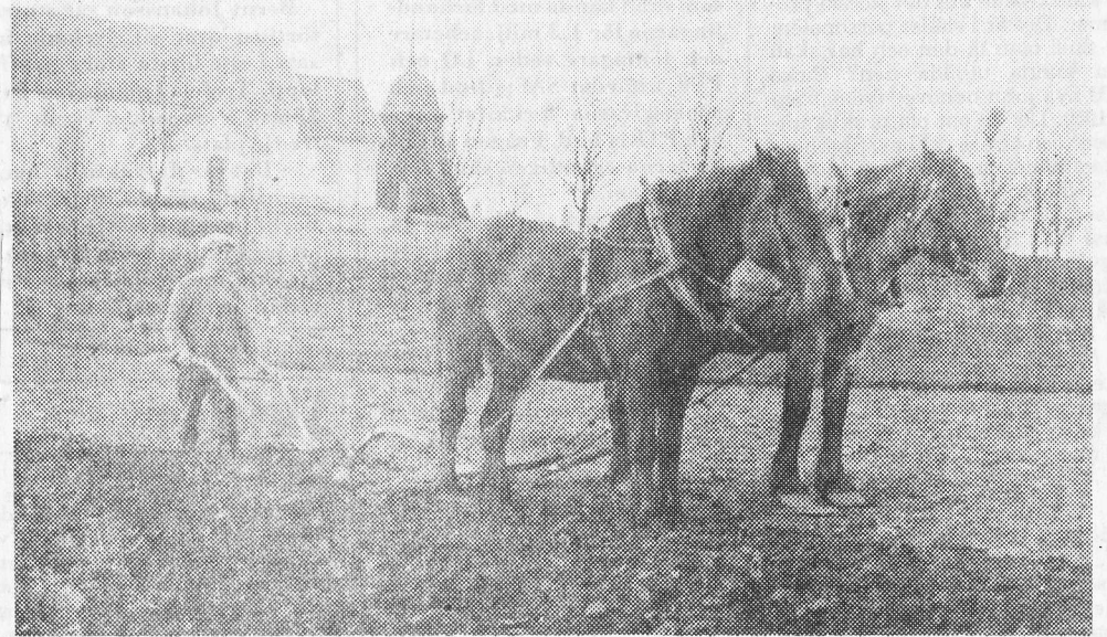
Plöjning nedanför Vårkumla gamla kyrka i jord som odlats i årtusenden.