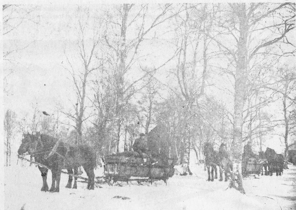
Torvkörning från Risholmen när man slog sig tillsammans i byn. Det blev ju lite roligare så med många par hästar framför slädarna.