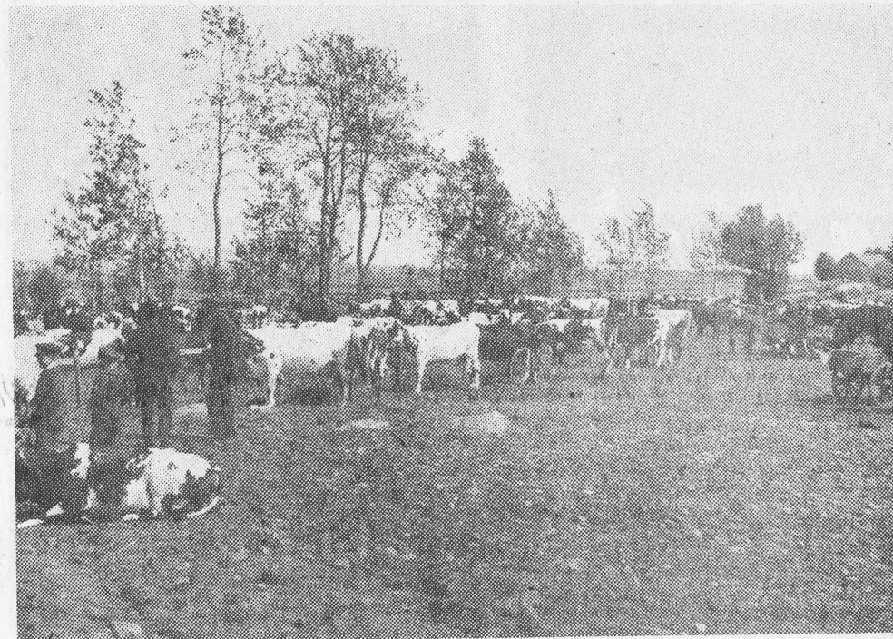
Kopremiering vid Hulegården omkring år 1915. Ett trettio-fyrtiotal kor syns på bilden, många troligen ättlingar till den i tjurföreningen tjänstgöranden tjuren Are av Ayrshire- ras. En unik bild i detta av hästpremieringar dominerande landskap.