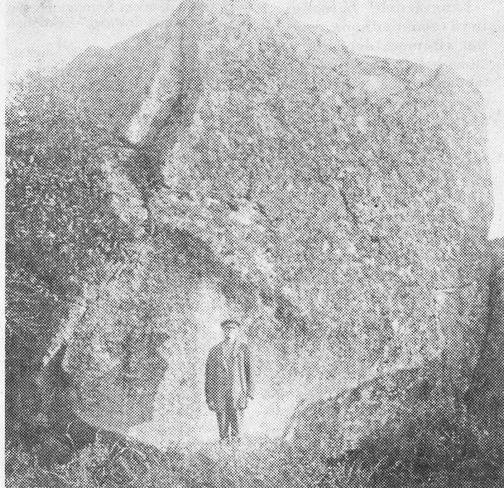
Som ett treriksröse ligger Välbergs sten i gränsen mellan Värkumla, Kinneveds och Smula socknar.