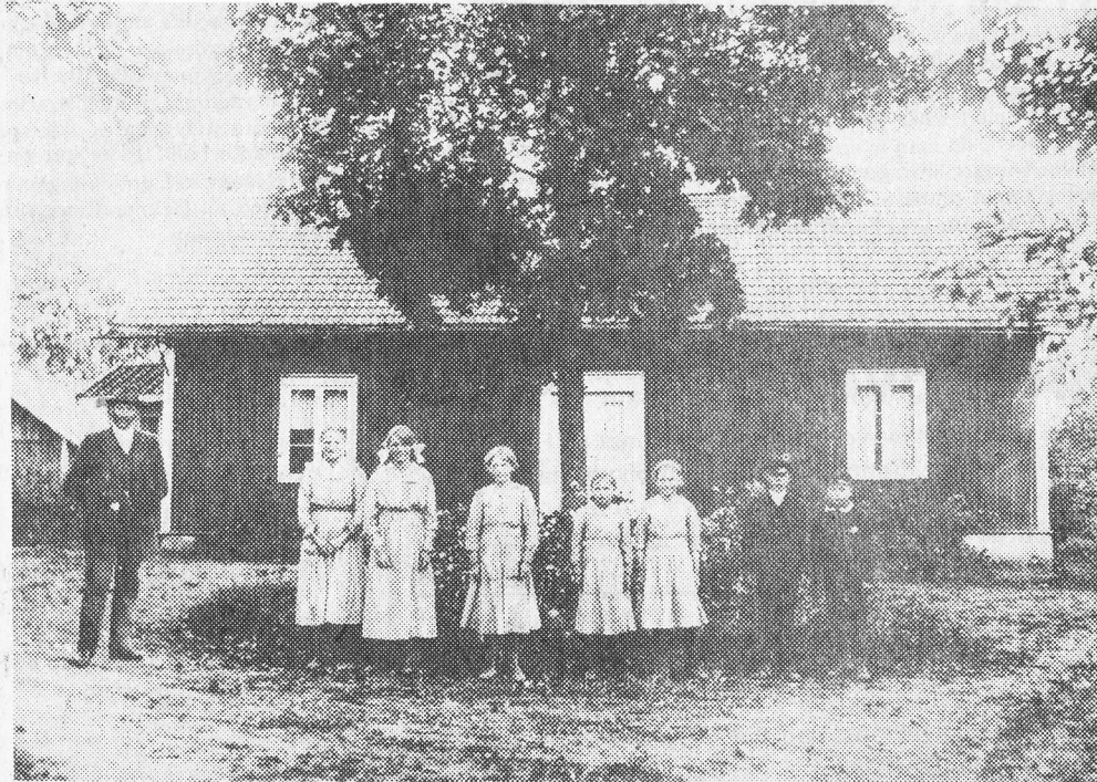
Posering för fotografen vid komministerbostället Vårskäl.